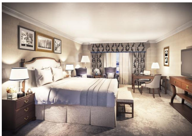
改装後のスーペリアルーム イメージ