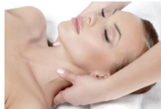
ペアトリートメント イメージ