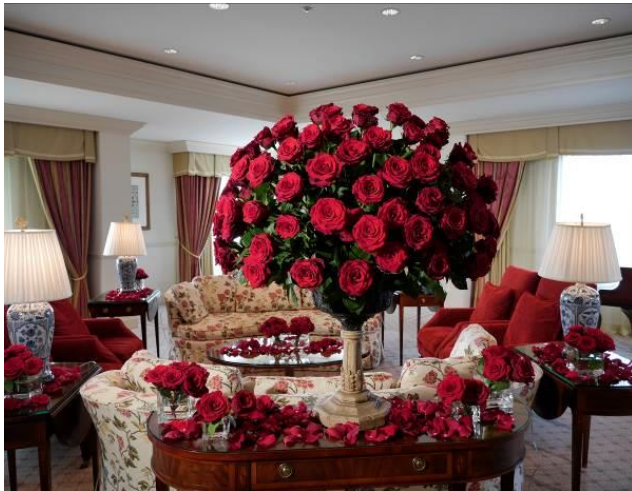
「ザ・リッツ・カールトン・スイート」200本のバラ イメージ