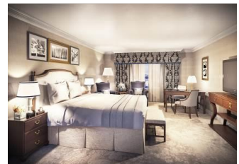
改装後スーペリアルーム イメージ