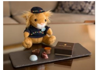
リオン君ぬいぐるみ・チョコレート