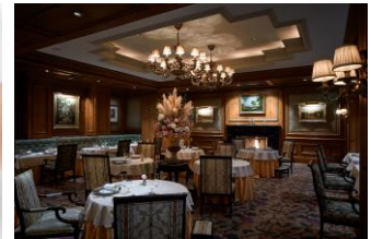
フランス料理「ラ・ベ」