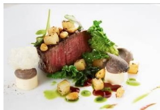
オーダーメイドディナー イメージ