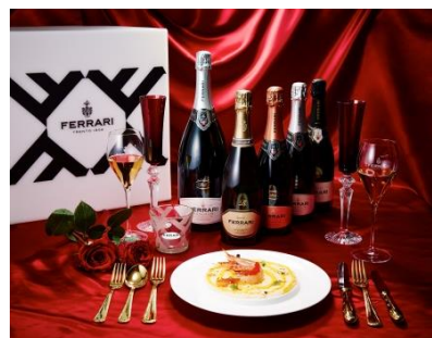
5/20 レッドディナー ウィズ フェラーリ イメージ

https://www.ritz-carlton.co.jp/information/592/