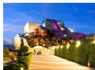
ホテル「マルケス・デ・リスカル」